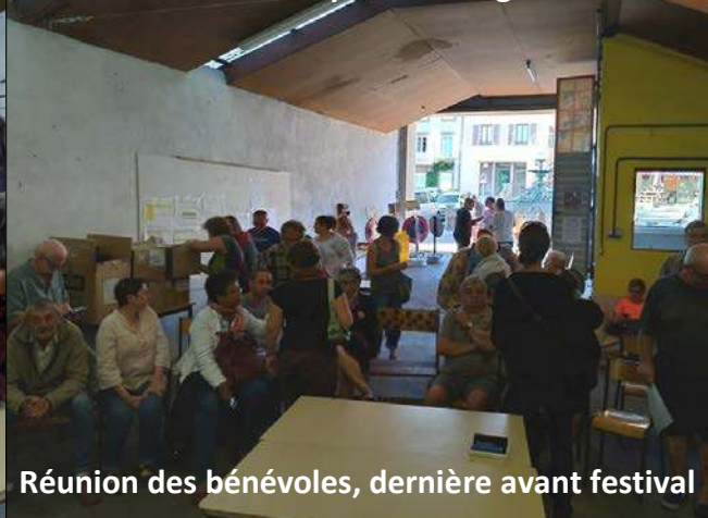
Réunion des bénévoles, dernière avant festival