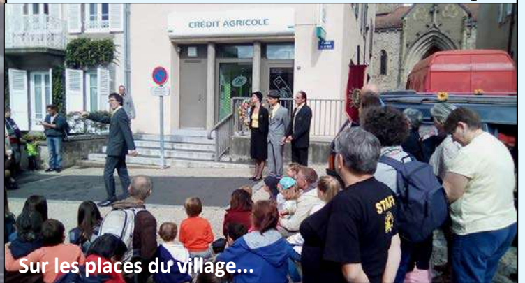
Sur les places du village...