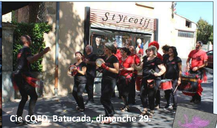
Cie CQED, Batucada, dimanche 29.