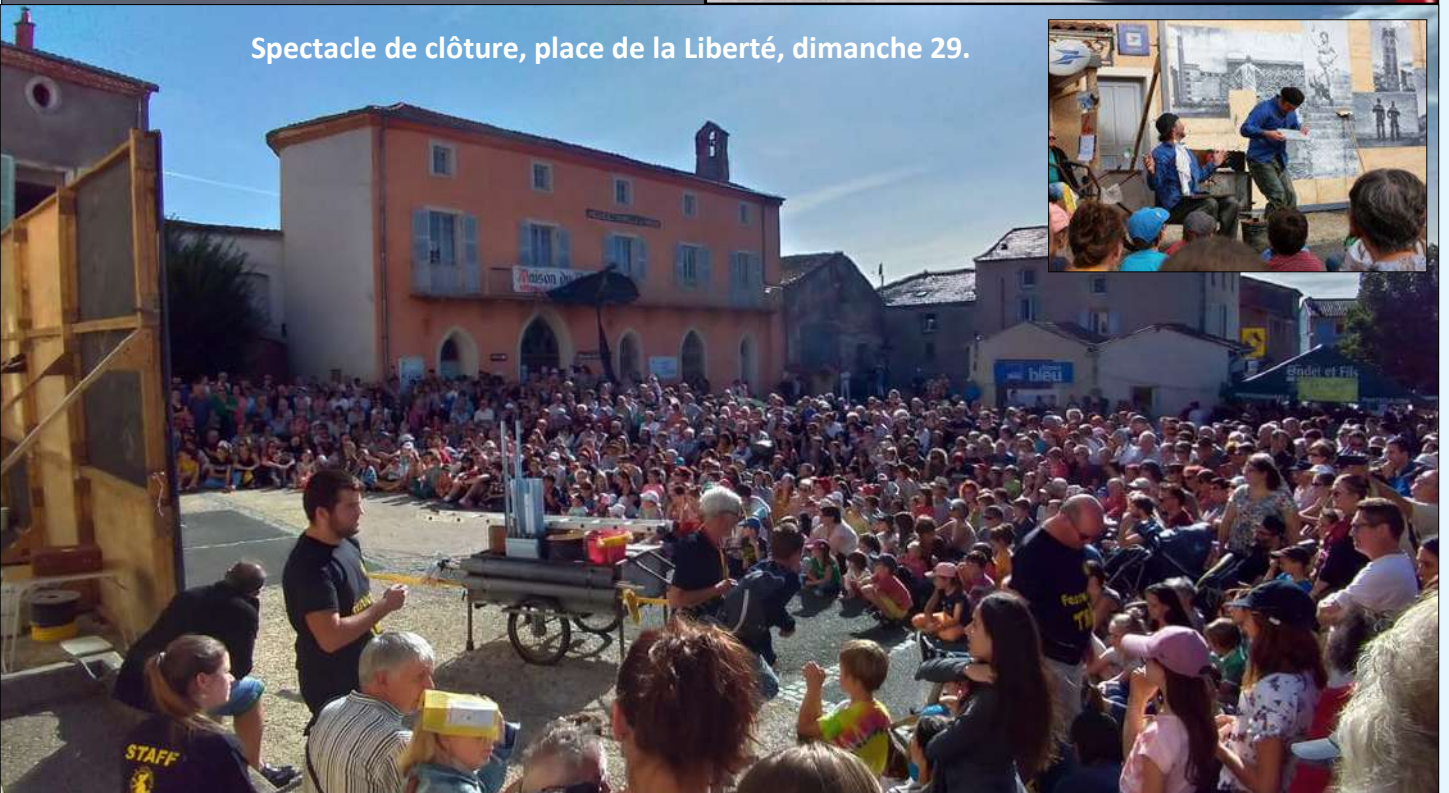
Spectacle de clôture, place de la Liberté, dimanche 29.