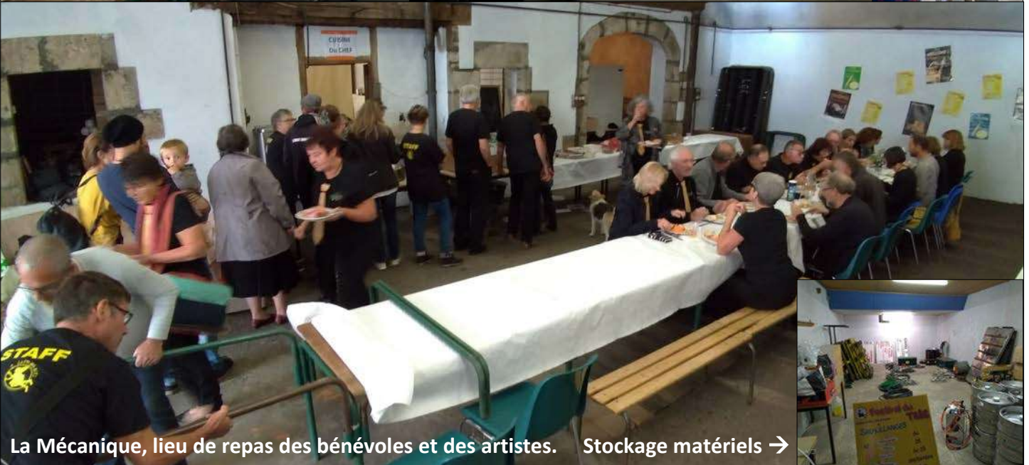
La Mécanique, lieu de repas des bénévoles et des artistes. Stockage matériels →