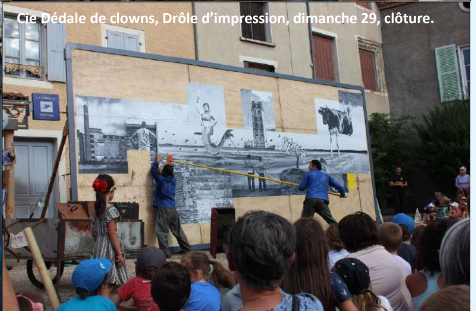
Cie Dédale de clowns, Drôle d'impression, dimanche 29, clôture.