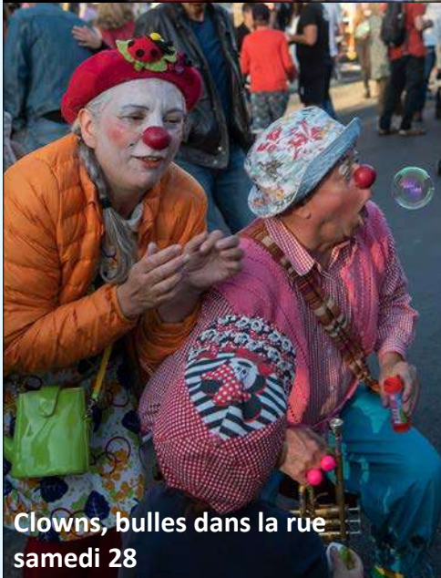
Clowns, bulles dans la rue samedi 28