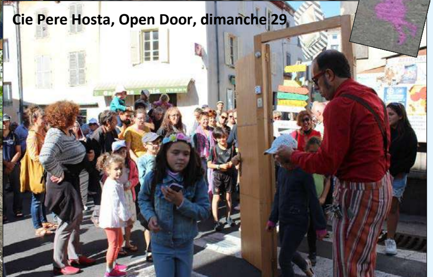
Cie Pere Hosta, Open Door, dimanche 29