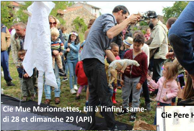
Cie Mue Marionnettes, Lili à l'infini, samedi 28 et dimanche 29 (API)