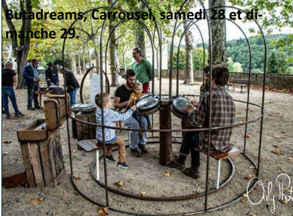
Butadreams, Carrousel, samedi 28 et dimanche 29.