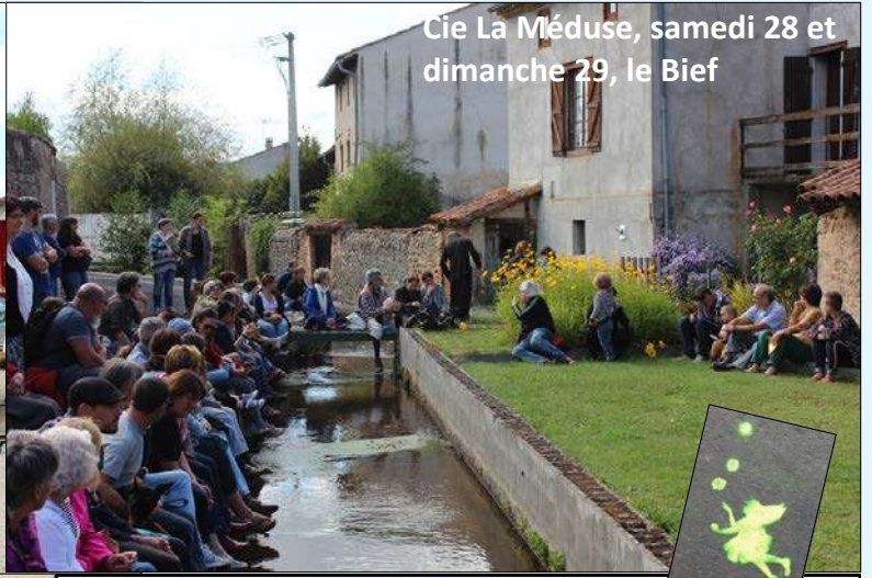
Cie La Méduse, samedi 28 et dimanche 29, le Bief