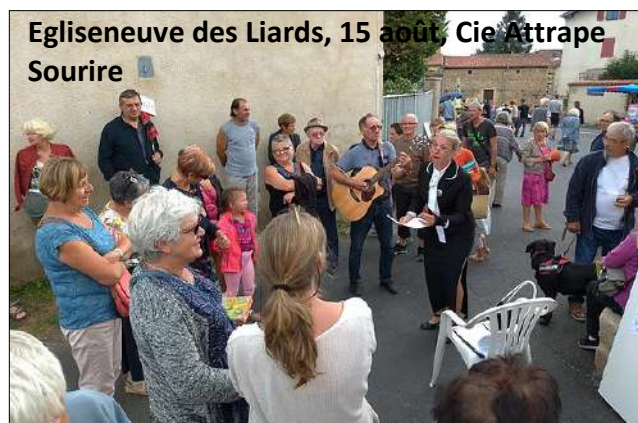
Egliseneuve des Liards, 15 août, Cie Attrape Sourire