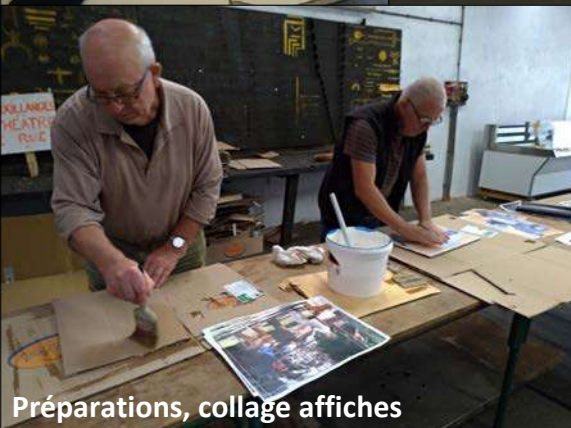
Préparations, collage affiches