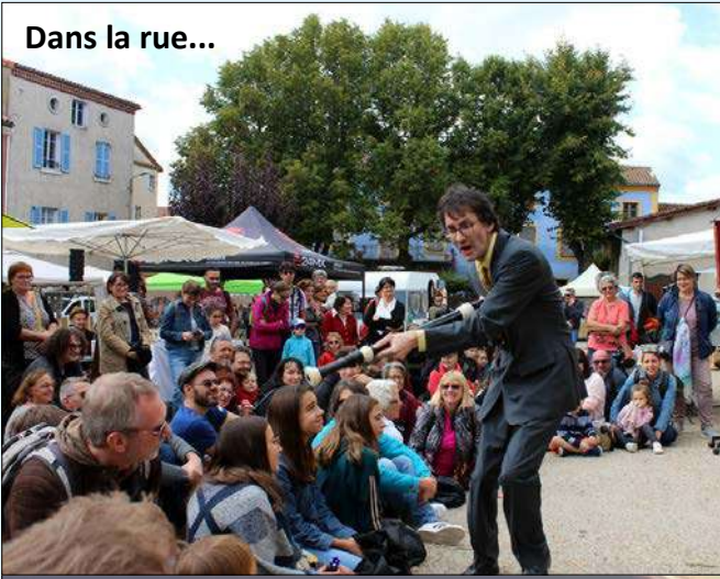
Dans la rue...