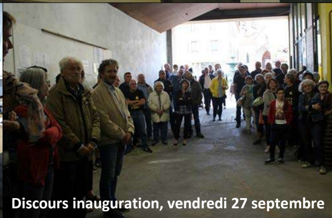
Discours inauguration, vendredi 27 septembre