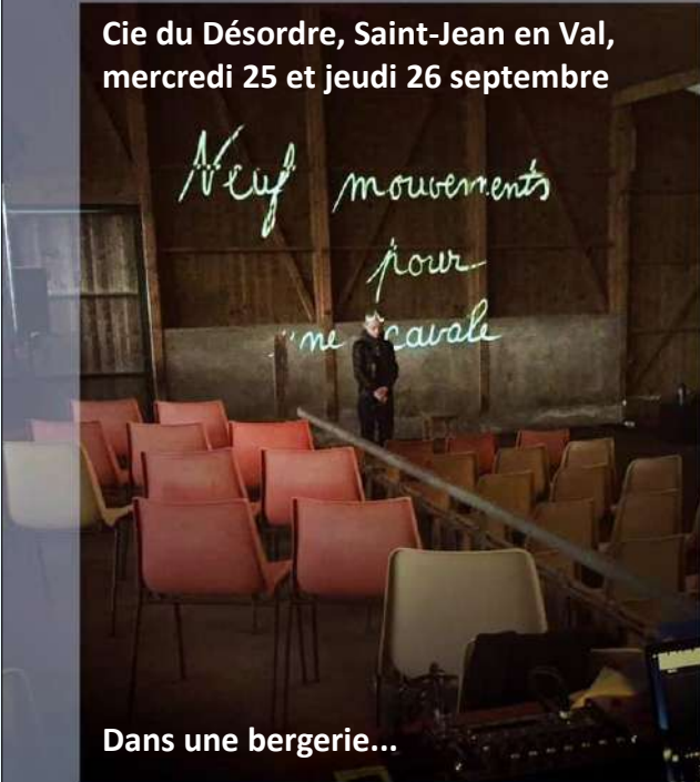
Dans une bergerie...