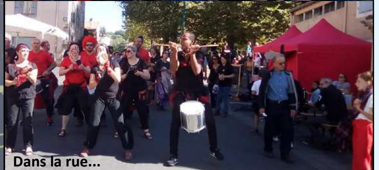
Dans la rue...