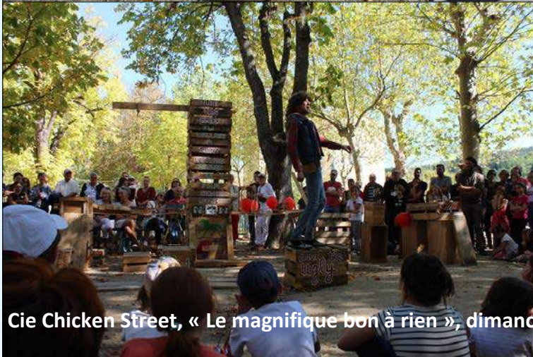
Cie Chicken Street, « Le magnifique bon à rien », dimanche 29