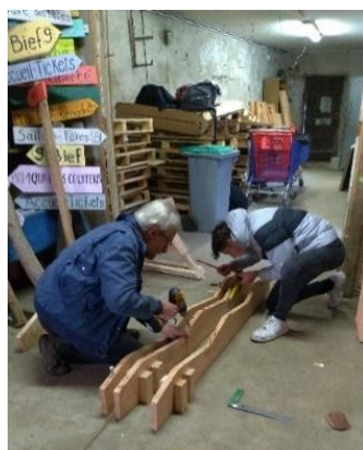
Atelier fabrication gradins