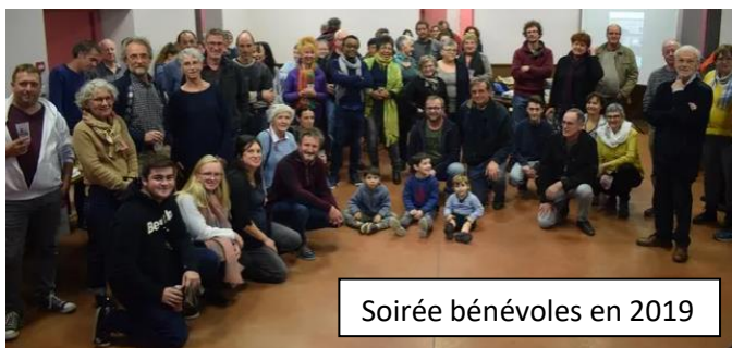
Soirée bénévoles en 2019