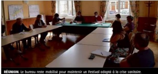
REUNION. Le bureau reste mobilisé pour maintenir un Festival adapté à la crise sanitaire.

Les membres du bureau de la Fée des Acts se sont rassemblés, samedi matin à la salle du conseil, pour une réunion préparatoire du prochain festival du Trac, qui doit se tenir du 24 au 26 septembre.