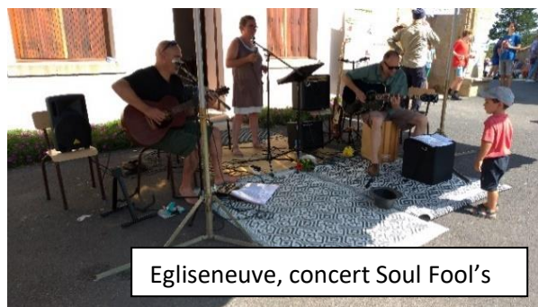
Egliseneuve, concert Soul Fool's