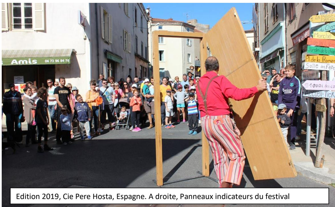
Edition 2019, Cie Pere Hosta, Espagne. A droite, Panneaux indicateurs du festival

De plus, un marché-exposition s'installera en partenariat avec la Ressourcerie, la cie Butadreams, le VALTOM.