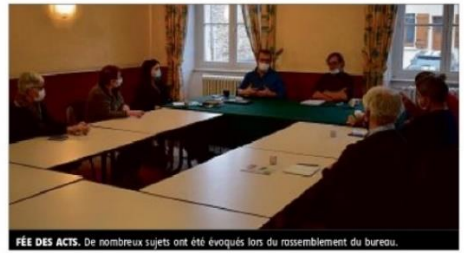
FÉE DES ACTS. De nombreux sujets ont été évoqués lors du rassemblement du bureau.

Autant de sujets qui font que les adaptations seront