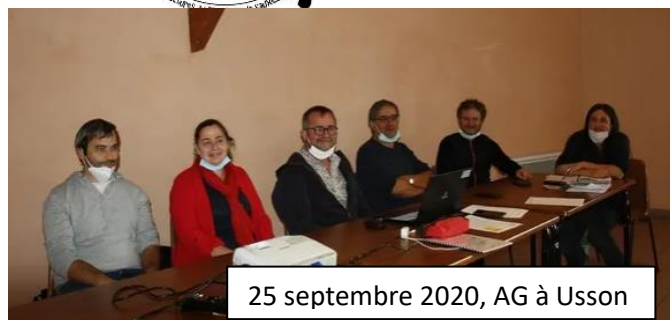
25 septembre 2020, AG à Usson