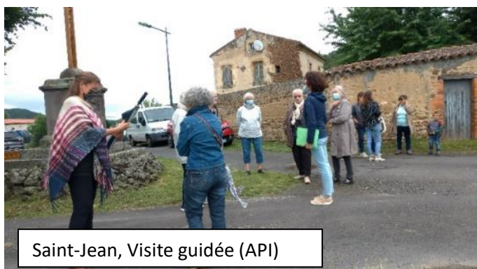
Saint-Jean, Visite guidée (API)