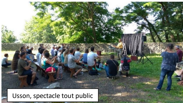
Usson, spectacle tout public