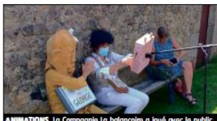
ANIMATIONS. La Compagnie la balancoïre a joué avec le public.

mis aux visiteurs d'assister au spectacle de marionnettes de rue donné par la Compagnie La balancoïre et intitulé « Les spontanés de George ».