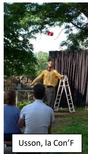
Usson, la Con'F