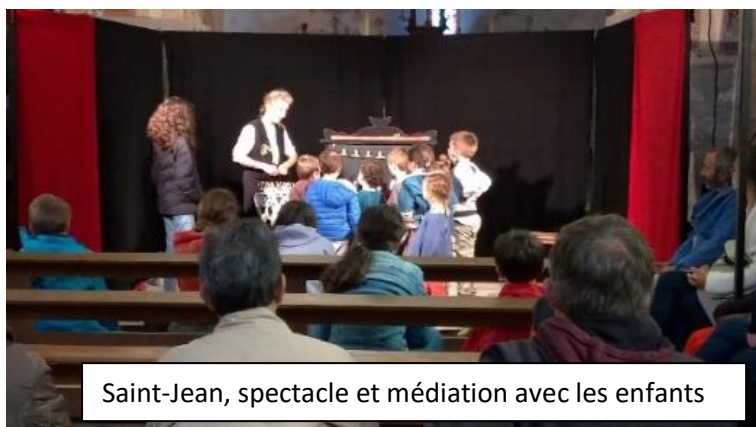
Saint-Jean, spectacle et médiation avec les enfants